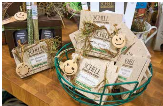
Köstliches Präsent nicht nur für Veganer.