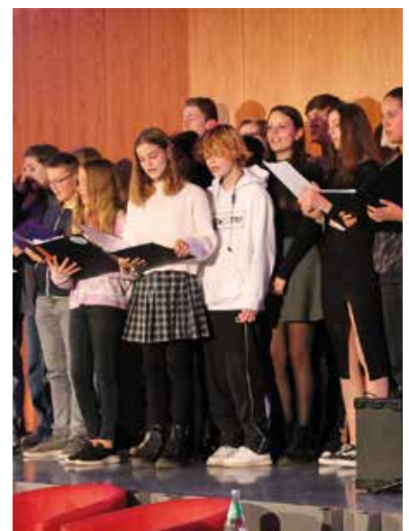
Die Abschlussveranstaltung wurde vom Chor des Gymnasiums Brandis eröffnet.