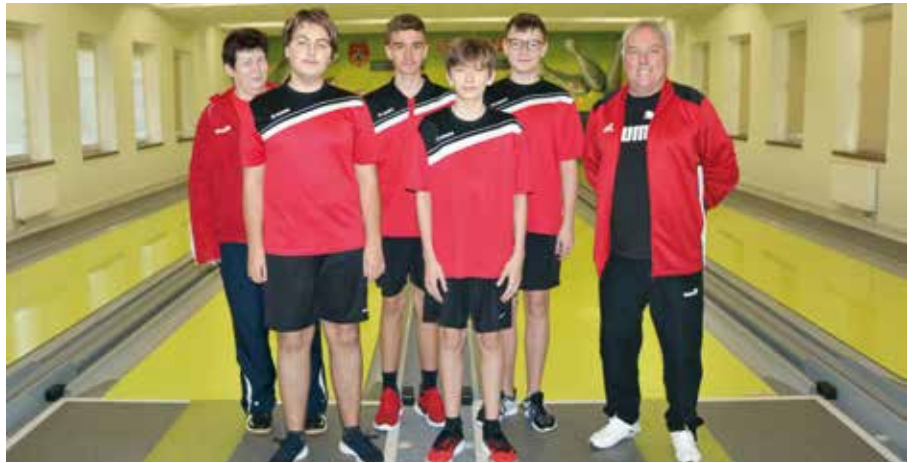
Für die U18 wurde eine neue Mannschaftsbestleistung erspielt.