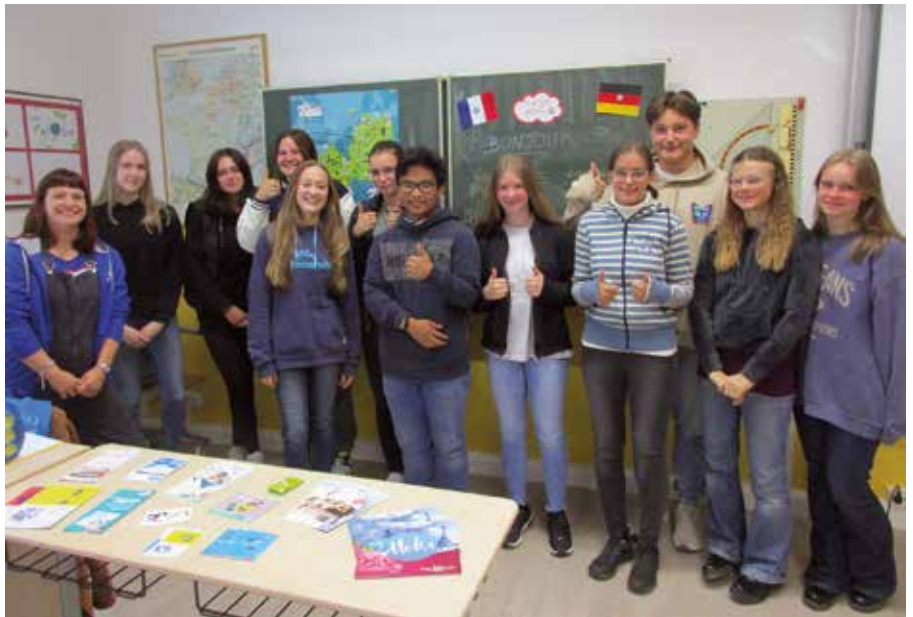
Die Schülerinnen und Schüler fanden des etwas anderen Französisch-Unterricht super.

„Ich fand es schön zu hören, wie die französischen Wörter ausgesprochen werden“, so der eine. „Ja, und wenn jemand etwas nicht verstanden hat, dann hat sie es bildlich erklärt“, so die andere. Am Ende war die Überraschung groß, dass Laurie