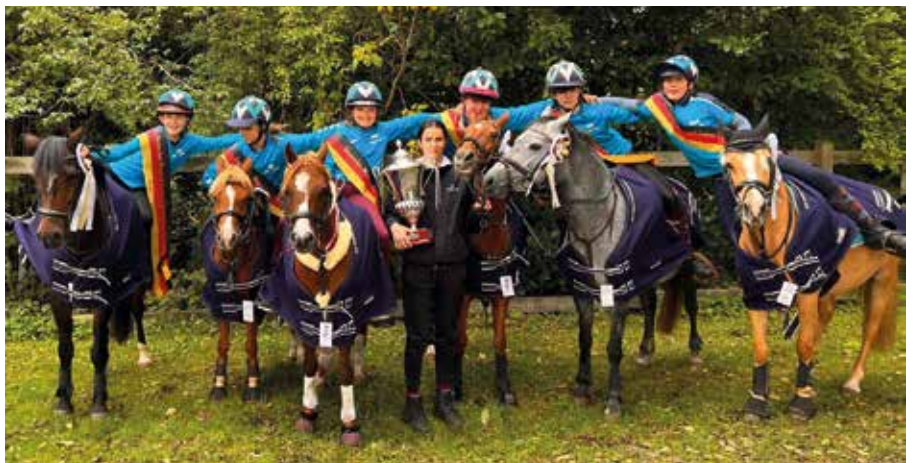
Die Deutschen Meister aus Wolfshain.

Am Sonntag wurden zwei weitere Läufe geritten. Und das Wolfshainer Rudel konnte