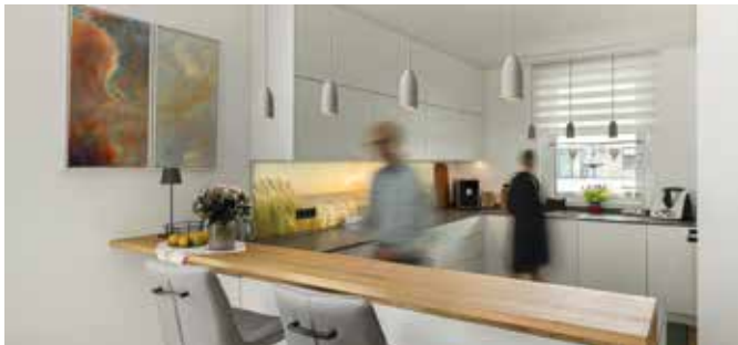
Filigrane Betonlampen sorgen für eine gleichmäßige Beleuchtung, ohne im Raum störend zu wirken.

Für eine angenehme Atmosphäre ist es wichtig, dass die Pendelleuchte von der Decke weder zu hoch hängt, damit man nicht hineingucken muss, noch dass sie zu tief sitzt, sonst stört sie im Blickfeld. Als