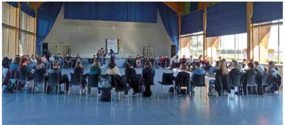
Der geloste Jugendrat tagte an zwei Tagen in Brandis, bevor die Ergebnisse im Forum der Oberschule präsentiert wurden.