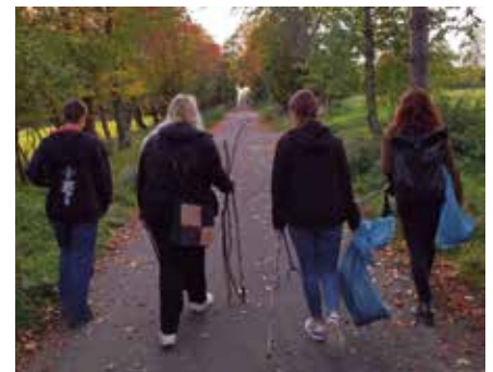
Im Oktober machten sich die Jugendlichen gemeinsam auf, um Müll zu sammeln.

Im Oktober lud das spoc dann zu einer gemeinsamen Müllsammelaktion ein. Wie bereits im Frühjahr sind etwa 15 Jugendliche, ausgestattet mit Handschuhen, Müllzangen und -säcken, losgezogen, um verschiedene Ecken in ihrer Stadt von Müll zu befreien. Anschließend haben sich die HelferInnen im Mauerwerk bei selbstgebackenem Essen gestärkt und am Lagerfeuer besser kennengelernt. Unterstützung bei der Aktion haben die Jugendlichen dieses Mal von Studierenden der HTWK Leipzig bekommen. Diese interviewen im Rahmen ihres Forschungsprojektes „Save your Hinterland“ junge Menschen, um Perspektiven aus ihrer Lebenswelt im ländlichen Raum festzuhalten und ihre Interessen und Wünsche herauszuarbeiten. Auch die Stimmen von den jungen BrandiserInnen wurden an die-