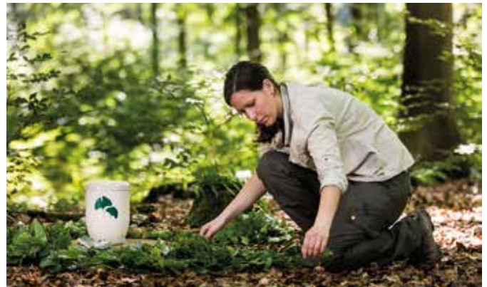
Eine Urnenbestattung ist auch im Wald möglich. Wer sich dafür interessiert, sollte das seinen Angehörigen rechtzeitig mitteilen, zum Beispiel im Rahmen eines Vorsorgegesprächs.