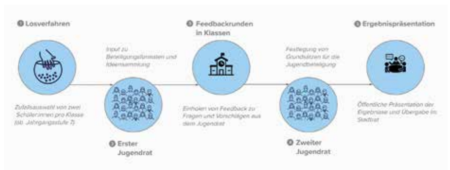
So sah der Ablauf des Projektes aus. Am 29. November werden die Ergebnisse im Stadtrat vorgestellt und übergeben.

man Jugendliche langfristig an politischen Entscheidungen beteiligen möchte und Demokratie damit erlebbar mache. Vor allem im Gegensatz zu den schon oft praktizierten Jugendparlamenten, die als Planspiel angeboten werden, kann man hier wirklich etwas bewegen. „Es ist nachhaltig und genau deshalb wurde der Jugendrat von Brandis über die Förderrichtlinie Bürgerbeteiligung unterstützt. Solche Formate sollen unbedingt Schule machen.“