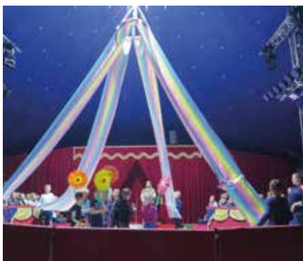
Höhepunkt des Zirkusprojektes war der Auftritt vor Verwandten und Freunden.

„Die Schule der kleinen Weltentdecker“ in Brandis führte vom 19. bis 23. September 2022 eine Projektwoche zum Thema Zirkus durch.