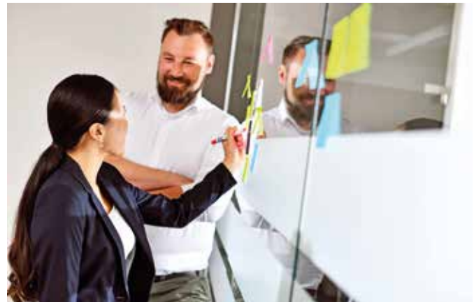
Die Expertise, um Menschen als Coach zu begleiten, erlangt man unter anderem in beruflichen Weiterbildungen.

nach Coaching wird in den nächsten Jahren, vor allem nun nach der Corona-Pandemie, sicherlich noch weiter zunehmen.“