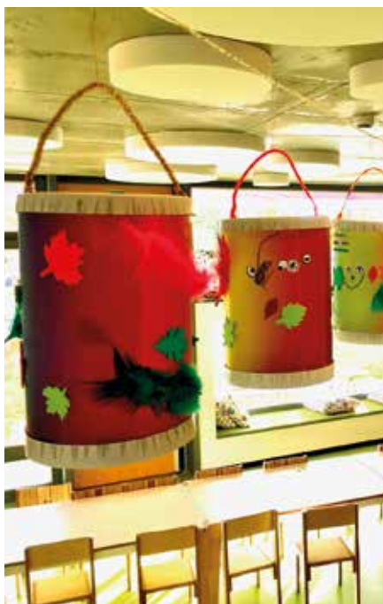
Die selbstgebastelten Laternen kamen Anfang November zum Einsatz.