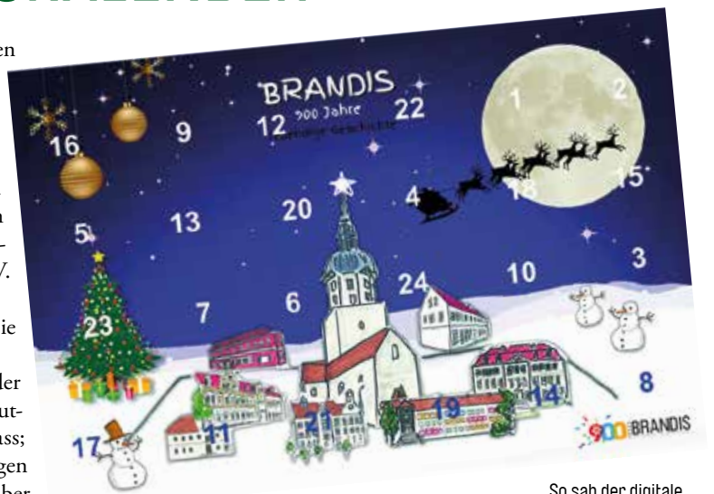
So sah der digitale Adventskalender im Jahr 2021 aus.

Es sollte der Türcheninhaber klar erkennbar sein und der Inhalt bzw. das besondere Angebot genannt werden, z.B. Gutscheine; Rabatt von bis; kostenlose Beratung; Auftragsnachlass; Zugabe; etc. - die Ideen sind frei. Wenn in den nächsten Tagen genügend Mitmacher sich melden, werden wir ab 01. Dezember starten. Das Druckhaus und der Stadtverein Brandis freuen sich auf Ihre Anmeldungen und Zuarbeiten. red