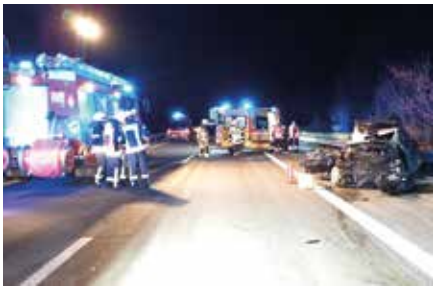
Im Oktober waren die Brandiser Kameraden drei Mal auf den Autobahnen im Einsatz.

Der Oktober gestaltete sich einsatzmäßig für uns relativ ruhig. Wir hatten nur fünf Einsätze. Am 21. Oktober wurden wir morgens zu einer Türnotöffnung gerufen. Unser Handeln war nicht notwendig, da der Pflegedienst mittels Schlüssel die Tür bereits geöffnet hat. An diesem Tag ging es für uns abends noch auf die Autobahn A 38 zu einem Unfall von zwei Pkw. Einen Tag später rückten wir am Nachmittag zusammen mit den Naunhofer Kameraden zu einem Pkw-Brand auf die Autobahn A 14 aus. Am