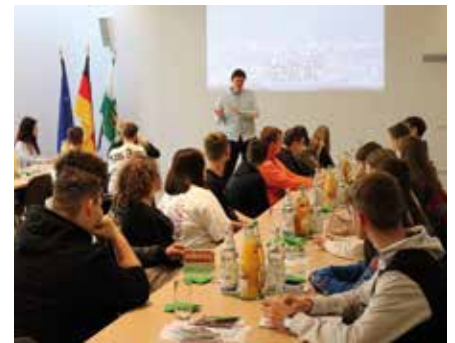
In Berlin besuchten die SchülerInnen die Landesvertretung Sachsens und den Deutschen Bundestag.

Die restlichen Schüler stellten die Bundesregierung und den Bundespräsidenten