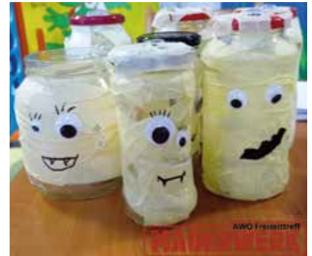
Gruselige Deko gehörte natürlich zur Halloween-Party dazu.

Für 2023 ist ein Jugendaustausch mit dem Motto „Zukunftslabor“ zwischen dem Landkreis Leipzig und dem Landkreis München geplant. In den Winterferien geht es in