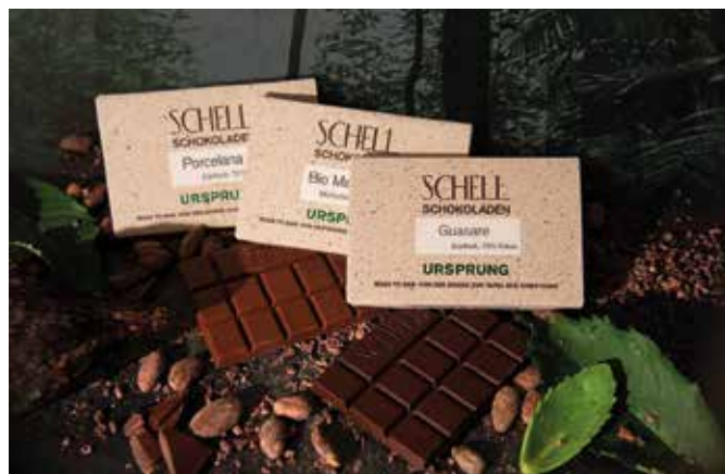
Von der Kakaobohne bis zur Tafel: Fair gehandelte vegane Schokoladen

Weitere Informationen erhalten Sie im köstlichen Floristikfachgeschäft Raumzauber-Sinnwelt in Naunhof und Leipzig/Engelsdorf sowie im Internet unter www.raumzauber-sinnwelt.de . Claudia Tenner