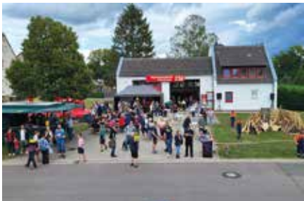
Viele interessierte Gäste besuchten den Tag der offenen Tür der Kameraden in Beucha.

Am 10. September 2022 fand in der Feuerwehr Beucha der langersehnte Tag der offenen Tür statt. 14 Uhr startete das Feuerwehrfest mit einem kleinen Akt an das Ehrenamt. Bei einer Ehrungsveranstaltung wurden Beförderungen und Ernennungen durchgeführt, die während der Corona-Zeit auf der Stecke geblieben sind. In den Reihen der Feuerwehr Beucha konnten fünf neue Kameraden begrüßt werden. Besonders erfreulich ist dabei, dass drei Kameraden davon aus der Jugendfeuerwehr übernommen werden konnten. Auch zwei kleine Jungkameraden wurden begrüßt, da in den letzten Monaten zwei Kameraden Väter geworden sind. Der kleine Truppmann und die kleine Truppfrau haben natürlich keinen richtigen Aufnahmeantrag erhalten, aber mit einem T-Shirt mit dem Feuerwehrmotiv können